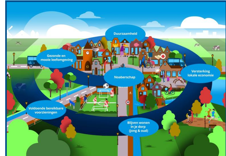
Spiraal van versterking (Provincie Overijssel)